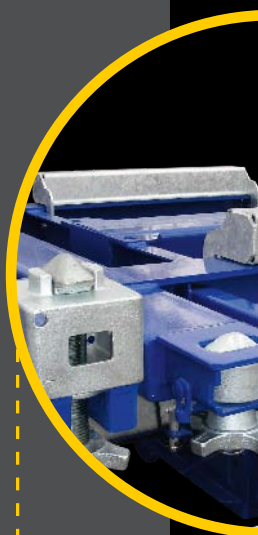
ŁATWE W OBSŁUDZE MECHANIZM SŁUŻĄCE DO PRZEMOCOWANIA KONTENERÓW PŁASKICH