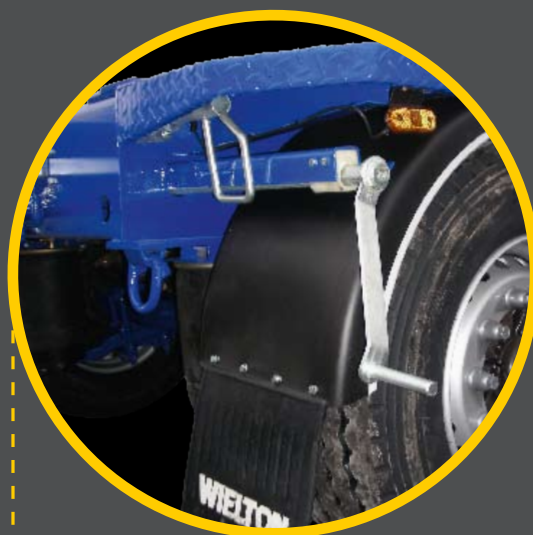
ŁATWY W OBSŁUDZE MECHANIZM WYSUWU I BLOKADA TYLNEJ CZĘ- ŚCI KONTENERA